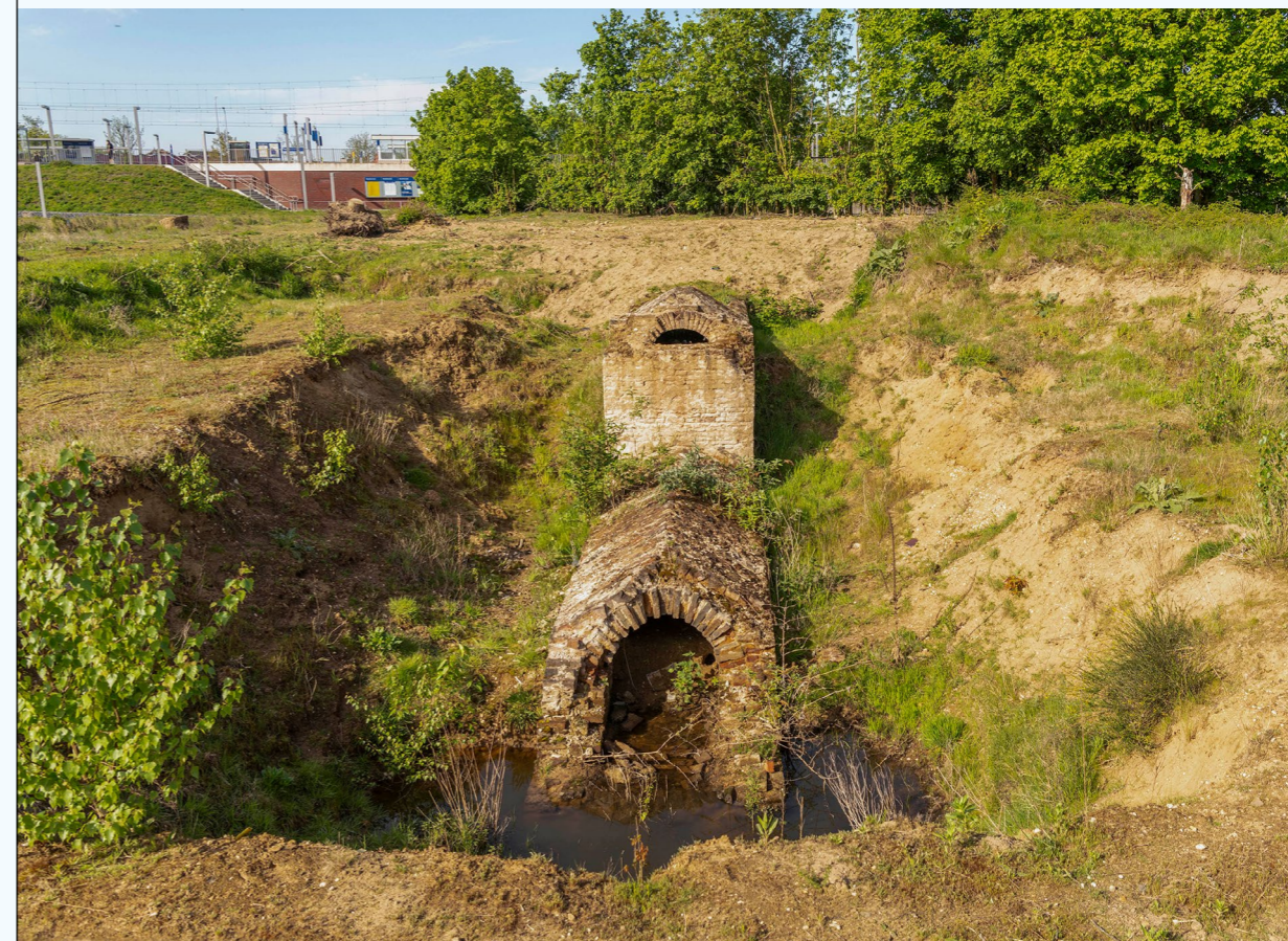
De historische grachtinlaat zorgde voor de toevoer van water naar de fortgracht. Het object blijft straks zichtbaar als ruïne in het nieuw aan te leggen stationsplein.

Er zijn menselijke skeletten, barakken, een kruithuis, een poterne, een bruggenhoofd en een overstortriool uit de Spaanse en de Franse tijd gevonden