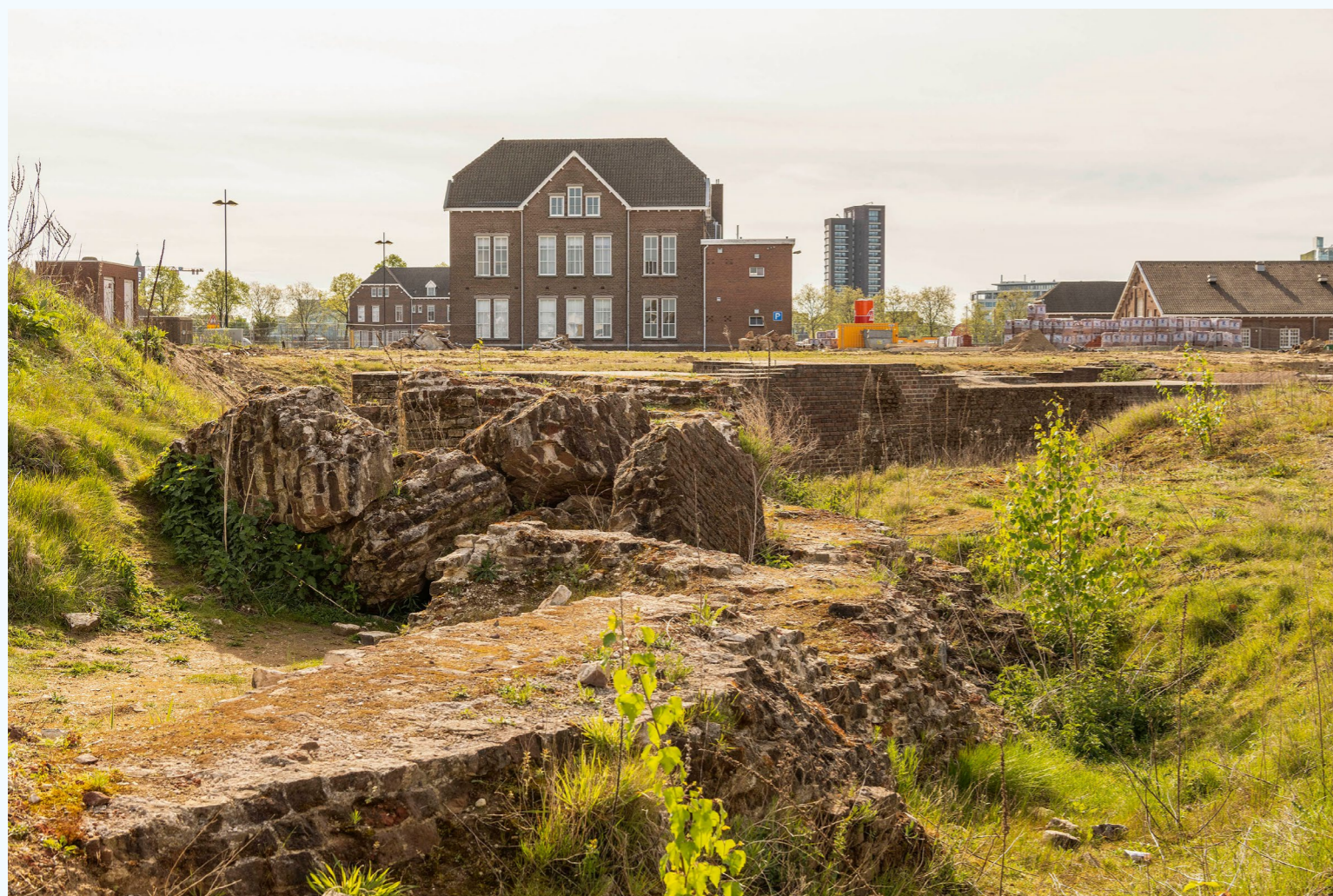
Huidige situatie van het Kazerneterrein. Op de restanten van de fortmuur komt een wandelpad en kunnen voetgangers straks een 'Rondje Fort' lopen.

Tegenover het centrum van Venlo in het stadsdeel Blerick krijgt de voormalige Frederik Hendrikkazerne een nieuwe bestemming. Hier komt de stadswijk Het Kazernekwartier. De gemeente Venlo koos voor een leidende rol van het erfgoed bij de herinrichting van het terrein. Als eigenaar van de openbare ruimte heeft de gemeente regie over de ontwikkeling.