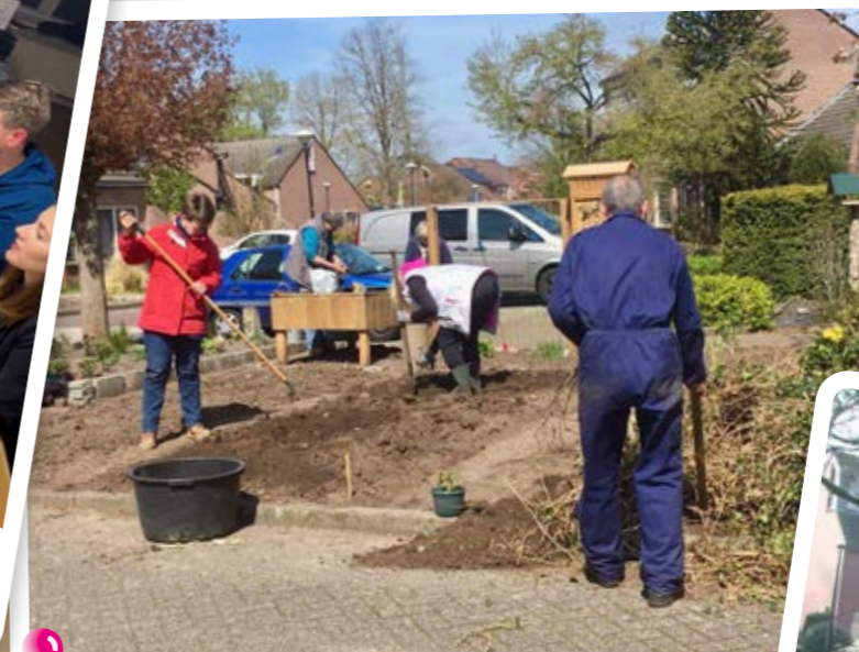
Aanleg tuin Pasbrink, voorjaar 2020