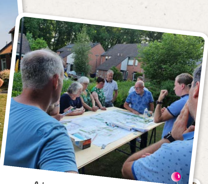
Schetssessie achter Pashegge, zomer 2021