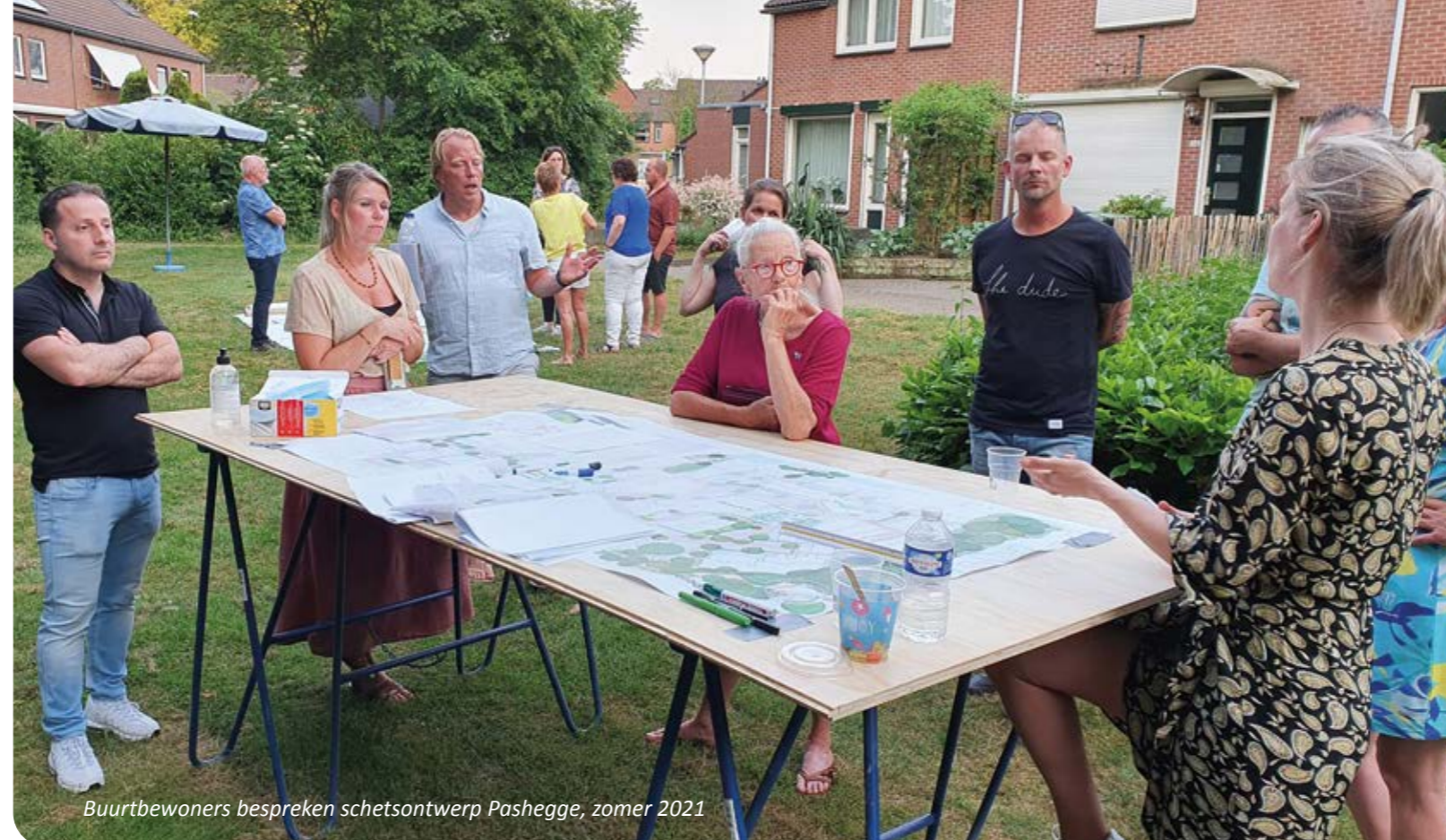
Buurbewoners bespreken schetsontwerp Pashegge, zomer 2021

"Bij wijkaanpak #UitDePas is het de bedoeling om de jaren-70 kenmerken van de bloemkoolwijk te laten aansluiten bij het veranderende gedrag en de wensen van de huidige bewoners. Toen de wijk ontworpen werd, was het klimaat nog helemaal geen probleem." Onze grootste uitdaging was dus om oplossingen te bedenken voor meer groen in de wijk, zonder dat dit ten koste gaat van het gebruik van de buitenruimte. Neem bijvoorbeeld het stijgende aantal auto's in de wijk. Daardoor zijn er meer parkeerplaatsen nodig. Het gevolg daarvan? Verminderende leefbaarheid, een groter ruimteprobleem en zorgen over de veiligheid. En dat terwijl de mensen ook meer groen willen en graag veilig willen spelen en recreëren in de wijk", legt Reinier uit.