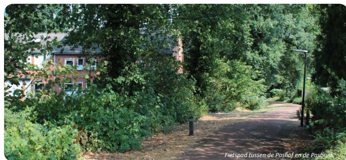
Fietspad tussen de Pashof en de Pasbrink