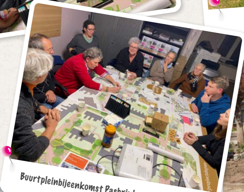
Buurtpleinbijeenkomst Pasbrink, november 2022