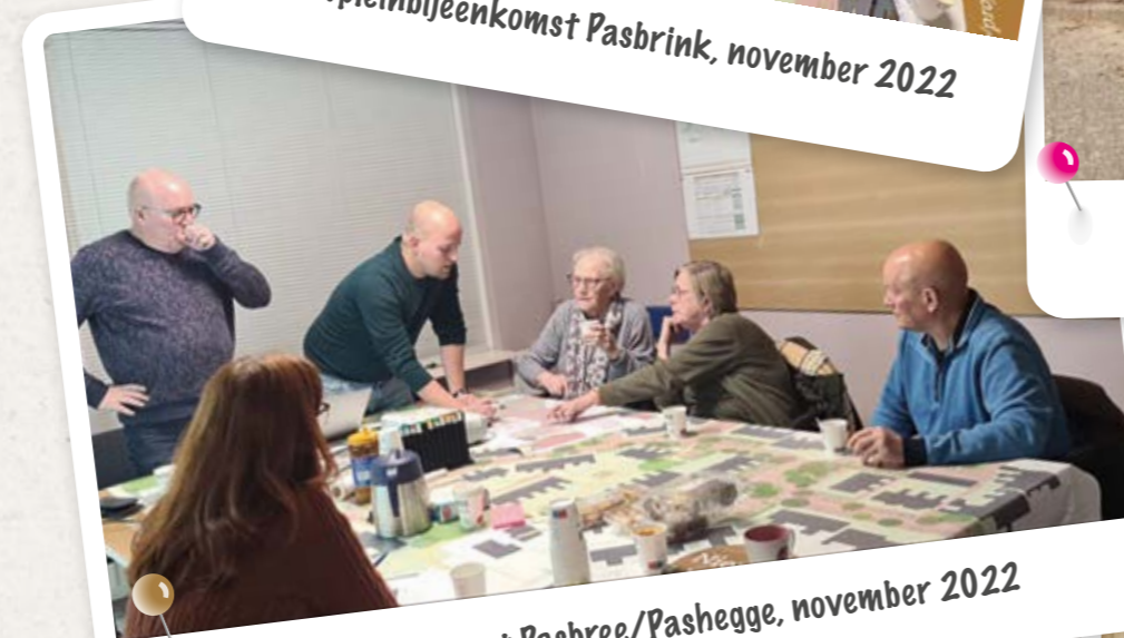
Buurtpleinbijeenkomst Pasbree/Pashegge, november 2022