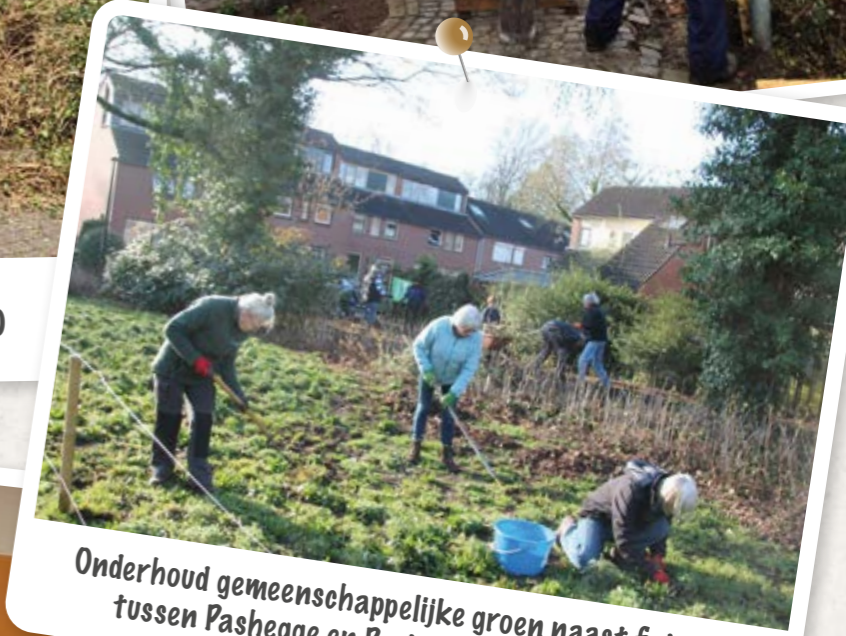
Onderhoud gemeenschappelijke groen naast fietspad tussen Pashegge en Pasbrink, voorjaar 2020