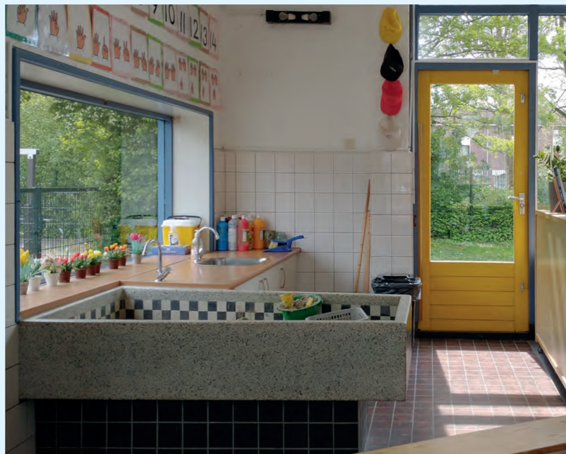
Interieur van de Beatrixschool. De speelkeuken voor de onderbouw is een typisch jarenzeventigdetail.