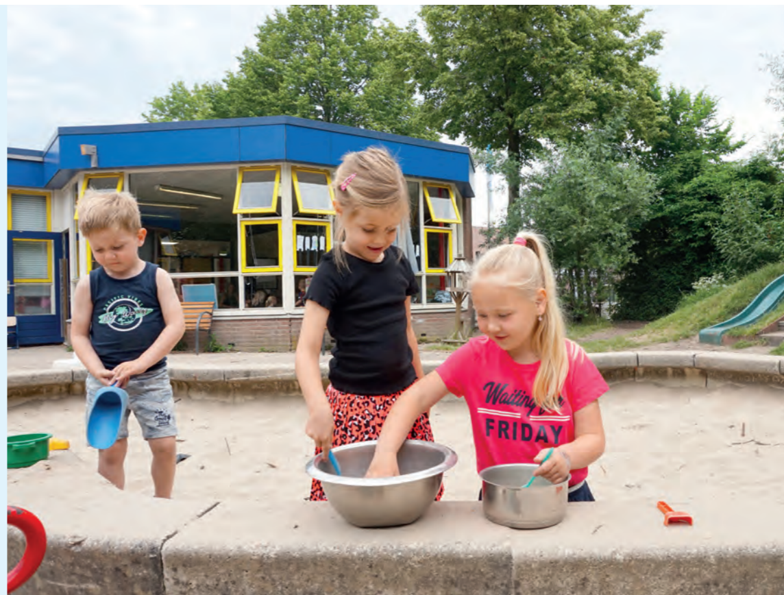
Kinderen spelen in de zandbak bij de Beatrixschool in de Nieuwegeinse wijk Wijkersloot.

'Voor de scholen in Nieuwegein, maar ook voor post '65-