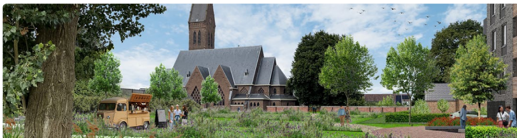
BURO ONTWERP &amp; OMGEVING

Het gaat om een gebied tussen de Waaldijk en de dorpskern, circa tien hectare groot. Motor en centrum van de ontwikkeling is de rijksmonumentale Leonarduskerk, die een nieuw leven krijgt als dorpshuis. Er komt een nieuwe basisschool, er worden woningen ontwikkeld voor starters en ouderen, een groen evenementenbrink en een dorpspark. Versterking van het dorps karakter en de ruimtelijke aantrekkelijkheid is uitgangspunt. De gemeente Overbetuwe stelt daartoe de cultuurhistorie centraal bij de stedenbouwkundige uitwerking, de openbare ruimte en de bebouwing. Het dorps hart zal daardoor aansluiten bij het DNA van Oosterhout en het landschap, die sterk bepaald zijn door de ligging aan de Waal, die welvaart bracht maar ook ontij, en de tuinbouw.